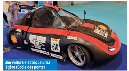
Une voiture électrique ultra légère (Ecole des ponts)

- Systèmes d'exploitation et billettique : c'est Kuba qui est récompensé pour son système Kubapay, une solution numérique qui permet de faire cohabiter plusieurs systèmes billettiques indépendants. Il permet d'accéder à de multiples services de transports dans un Pass unique. L'objectif de Kubapay est de rendre invisible pour les clients