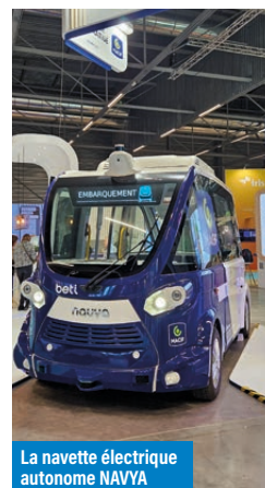
La navette électrique autonome NAVYA

Certains pays européens ont par contre réussi à mettre sur pied des structurations plus imbriquées, qui permettent de mieux piloter et financer les transports publics. En Autriche, Allemagne ou Suisse par exemple, transports et logement sont associés, leurs