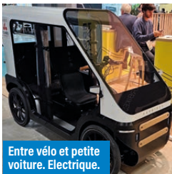
Entre vélo et petite voiture. Électrique.