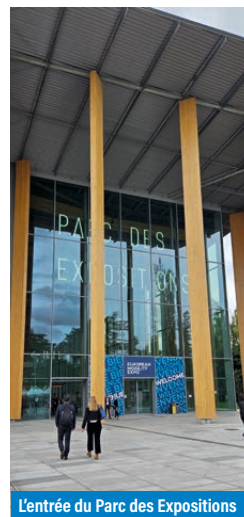
L'entrée du Parc des Expositions

Sur la voiture, de plus en plus de jeunes ne voient aucun intérêt à passer leur permis. C'est même considéré comme ringard. Une étude de l'IFOP