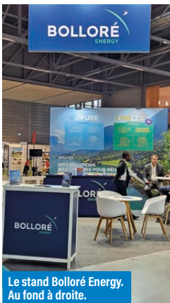
Le stand Bollore Energy. Au fond à droite.