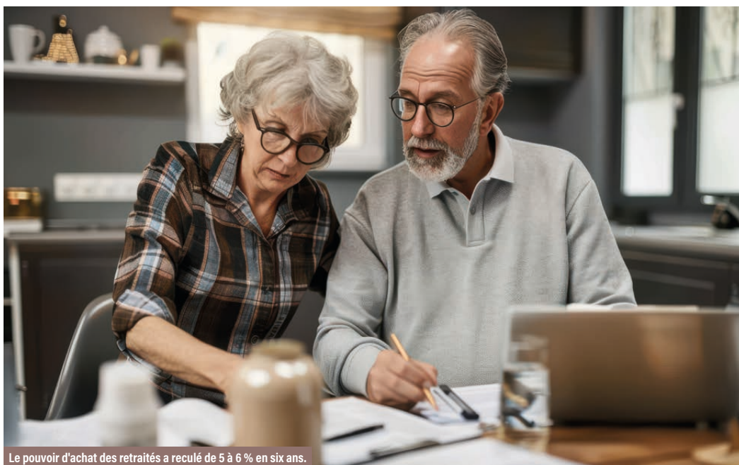
Le pouvoir d'achat des retraités a reculé de 5 à 6 % en six ans.

Au total, les pensions ont progressé de 1 % de moins que le salaire moyen sur l'année 2022.