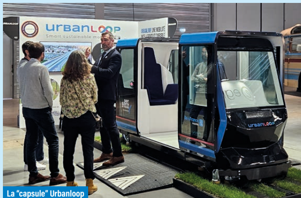
La "capsule" Urbanloop

En site propre, sur des voies à écartement d'un mètre, des capsules peuvent emporter deux passagers maximum (pour l'instant). Elles puisent leur énergie dans une alimentation très basse tension qui file dans les rails (et n'embarquent donc pas de lourdes batteries). Les rails sont fixes, il n'y a aucun appareil de voie, le guidage est réalisé directement par chaque capsule selon le trajet qui lui a été demandé. Cerise sur le gâteau, chaque station est équipée d'une voie de dérivation qui permet de l'éviter pour se rendre directement de son point de départ à son point d'arrivée, sans arrêts intermédiaires. Des repères fixes dans la voie sont lus par les capsules et leur permettent de savoir à tout moment où elles se trouvent avec une précision de quelques