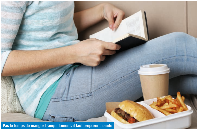
Pas le temps de manger tranquillement, il faut préparer la suite

“ Cette volonté d'ouvrir nos portes permettra, nous l'espérons, de mieux appréhender le quotidien et le travail de fond qu'effectuent les représentants syndicaux au sein d'une entreprise. ”