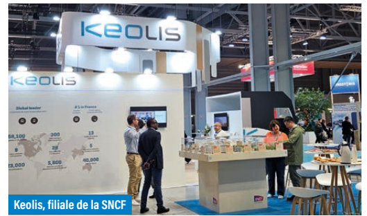
Keolis, filiale de la SNCF

La situation à Vienne est différente. La ville, très orientée vers les mobilités décarbonées et publiques, disposait déjà d'un dense réseau de tramway. Elle a ajouté 50 bus électriques et 10 bus à hydrogène. Le financement des transports publics