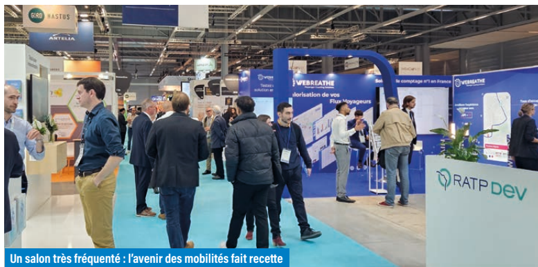
Un salon très fréquenté : l'avenir des mobilités fait recette