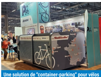
Une solution de "container-parking" pour vélos