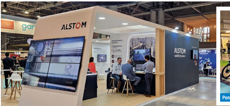
Le "stand-tramway" d'Alstom