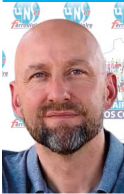
Par Fabrice CHARRIÈRE

Secrétaire Général de l'UNSA-Ferroviaire