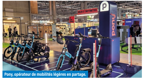
Pony, opérateur de mobilités légères en partage.