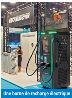
Une borne de recharge électrique

stratégies de développement sont cohérentes entre elles. C'est parfois le cas en France - involontairement - avec la loi ZAN (zéro artificialisation nette) qui incite à construire dans des zones généralement déjà équipées en transports.