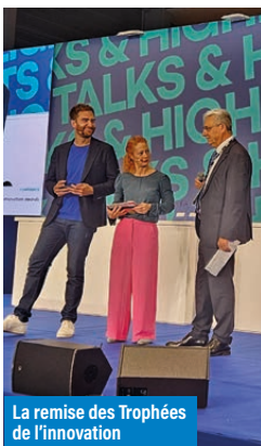
La remise des Trophées de l'innovation