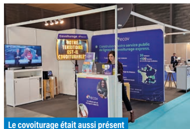
Le covoiturage était aussi présent