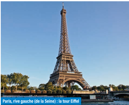
Paris, rive gauche (de la Seine) : la tour Eiffel

les transports collectifs pour rejoindre leurs locaux. Elles prendront une heure pour organiser une réunion avec les salariés concernés.