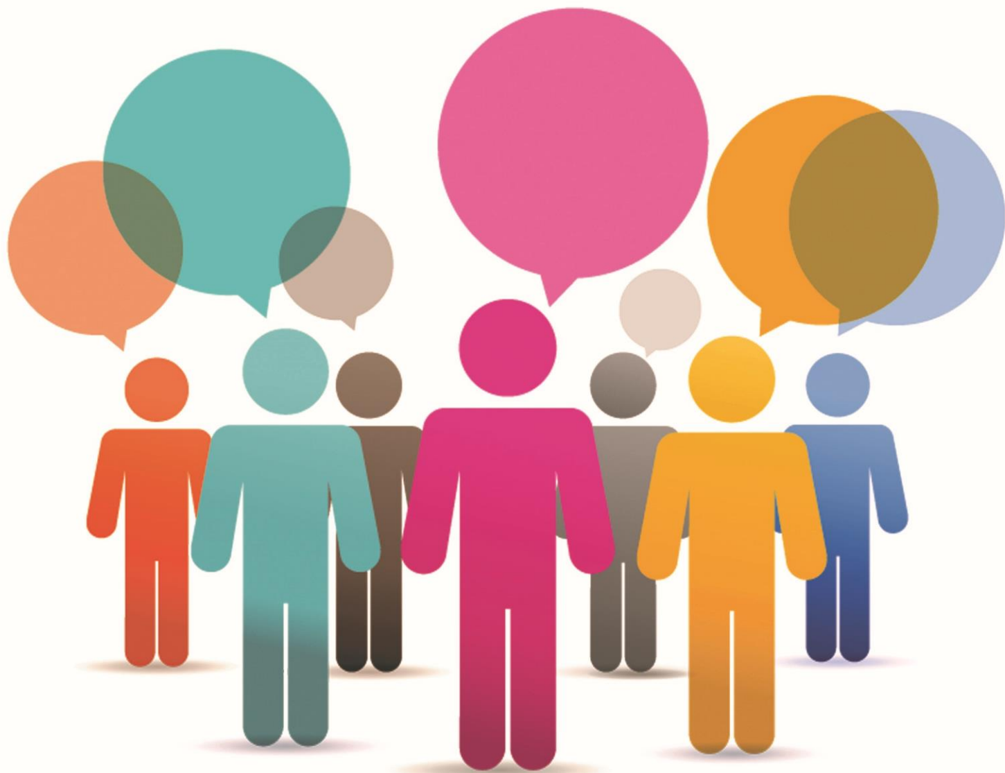
Tableau de service Directions Centrales et Régionales Chapitre 9 de l'Accord d'Entreprise – Article 25 Régime A